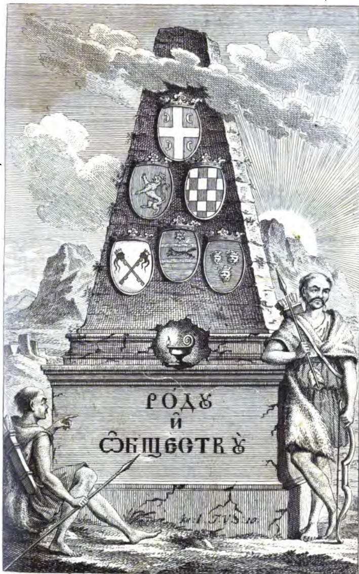
рисовакъ Іак. Орфелинъ